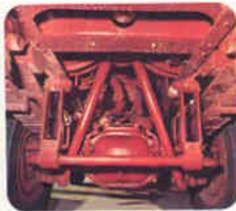
Stabilisatoren an der Hinterachse Serienmäßig für alle Zweiascher