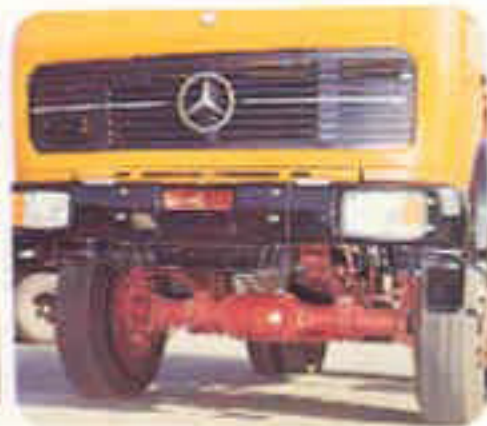
Allrad-Vorderachse Großer Einschlagwinkel von 42° und große Bodenfreiheit.