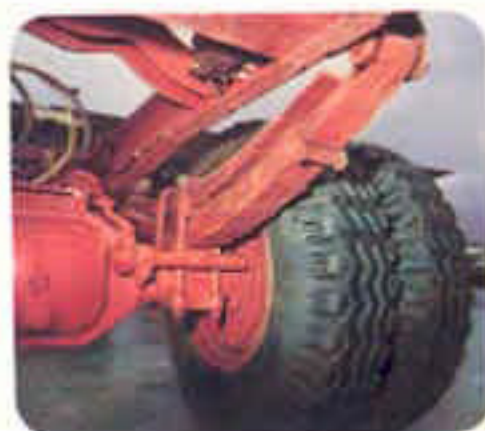
Außenplaneten-Hinterachse mit Zweistufen-Blattfeder.