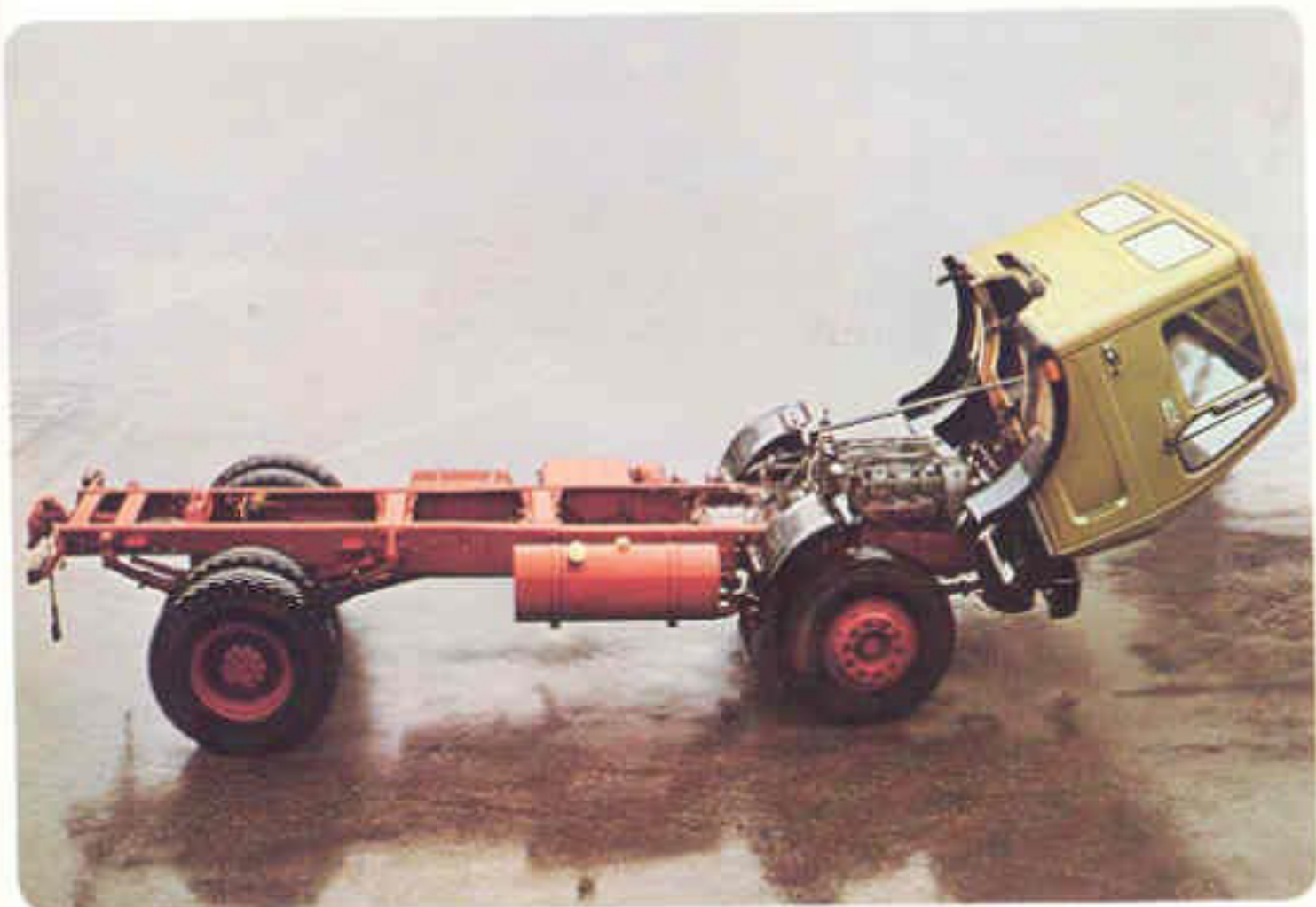
Fahrgestell Zweiascher Mit oder ohne Allradantrieb