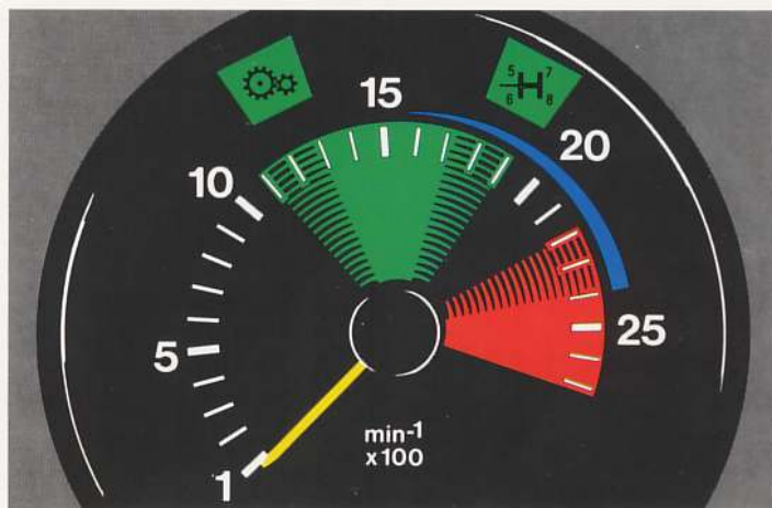
Motor MAN 6 cylinder met turbo oplading en intercooling

Dankzij dit hoge koppel kan de chauffeur een bijzonder gunstig verbruik realiseren. Een bijkomend gunstig effect is, doordat de trekkracht al bij relatief lage toerentallen vrijkomt, dat motorslijtage aanzienlijk verminderd wordt. Een direct gevolg hiervan is: minder onderhoud en een lange levensduur.