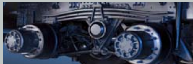
리어 파라볼릭스프링 (핀스프링:1580mm)