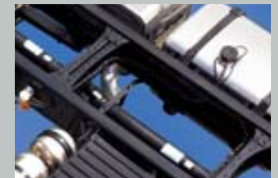
도릭스 650 고장력 강판