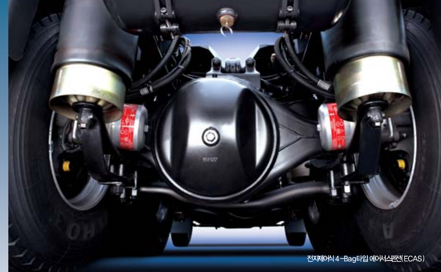
전자제어식 4-Bag타입 에어서스펜션(ECAS)