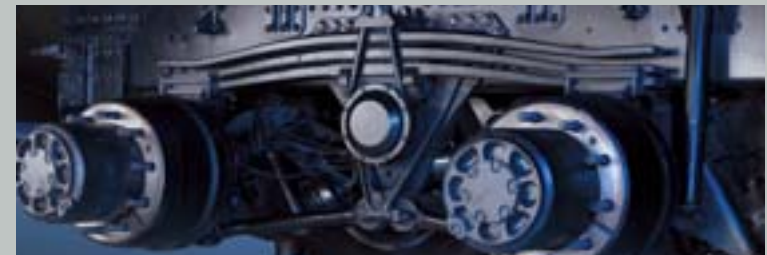
전·후축 파라볼릭 스프링