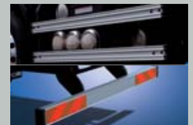
알루미늄 측면 보호대 & 후부 안전판