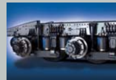
국내 최초로 카고에 적용되는 4-BAG타입 에어서스펜션(옵션)