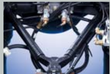
V-ARMEIP 레이저 로드