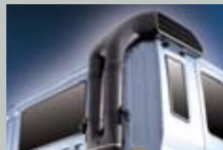
하이 스푼클 타입 에어인덕트