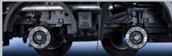
프론트 파라볼릭스프링(10x4/8x4카고, 8x4덤프:1,900+1,580mm), (트랙터:1,900mm)