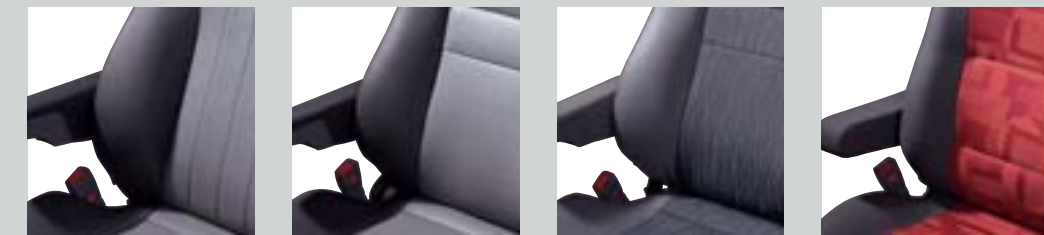
가죽투톤, 가죽투톤, 인조가죽 투톤, 직물투톤