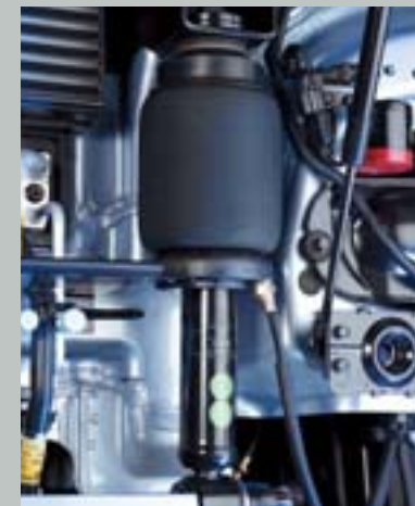
최대 용량의 대형 캡 프론트 에어서스펜션