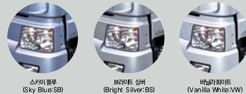
스카이블루 (Sky Blue:SB), 브라이트 실버 (Bright Silver:BS), 바닐라화이트 (Vanilla White:VW)