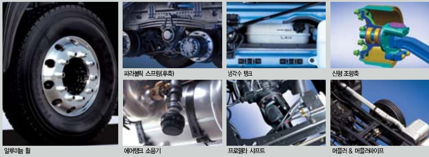
알루미늄 휠, 파라볼릭 스프링(후축), 냉각수 탱크, 신형 조향축, 에어탱크 소음기, 프로펠라 샤프트, 머플러 & 머플러파이프

안전운행을 위한 일상점검과 정비를 용이하게 해주는 개폐식 프론트 패널의 트라고트럭은 필수적인 점검부품을 집중배치해 효율성을 높였습니다