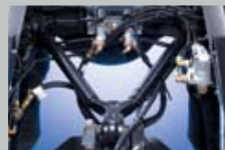
V-ARM타입 래디우스 로드