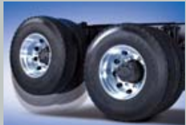
에어리프팅 시스템 (6X2 트랙터)