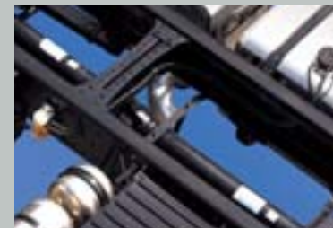
도덱스660 고정력 강판