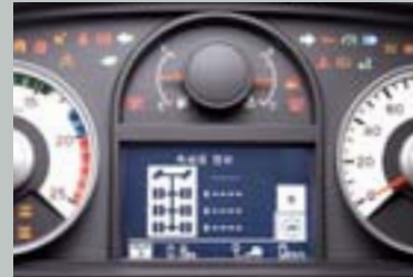
축하중 표시 멀티펑크셔널 계기판 (6X2 트랙터)