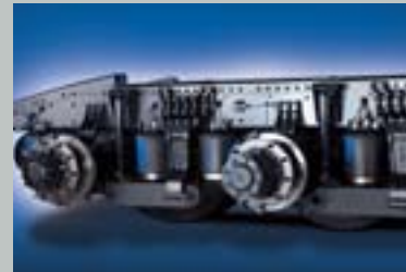
전자제어식 4-BAG타입 에어서스펜션 (6X2 트랙터)