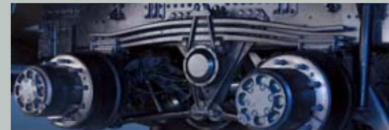
전·후축 파라볼릭 스프링