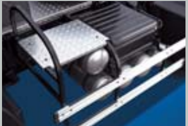
알루미늄 플랫폼 및 사다리