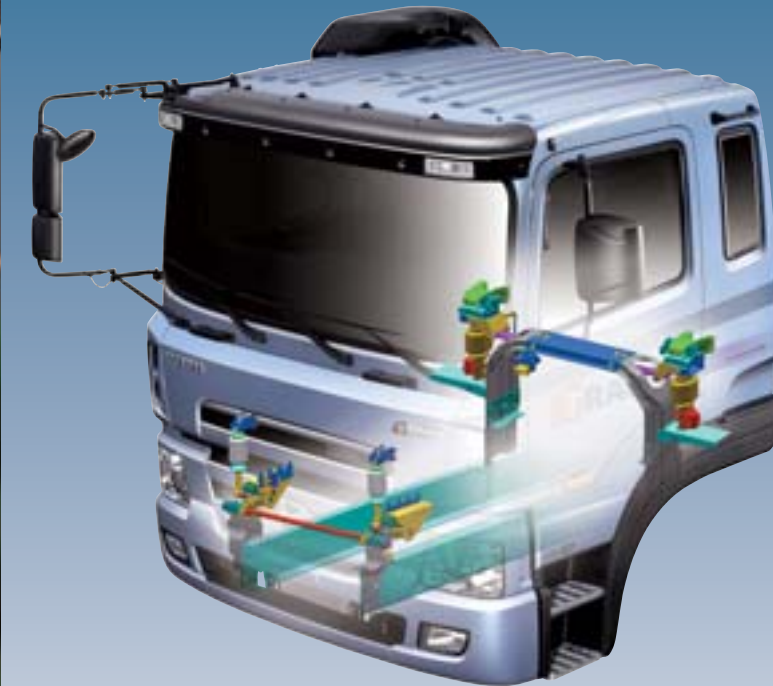
신형 에어플로팅 캡서스펜션