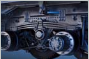
전·후축 파라볼릭 스프링 (6X4 트랙터)