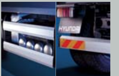
알루미늄 측면 보호대 & 후부 안전판