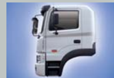
국내 최초의 데이캡(옵션)