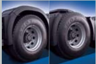
신형 트랙터 팬더